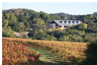
チョークヒル エステート

産地・AVA：Chalk Hill 品種：93% Sauvignon Blanc 7% Sauvignon Gris アルコール：14.6% 希望小売価格：¥5,200（税込¥5,720）