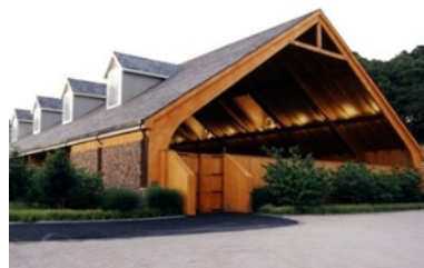
ドレサージュアリーナ（高等馬術競技場）