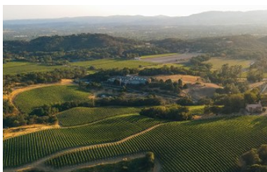
チョークヒル エステート ヴィンヤード

産地・AVA：Chalk Hill 品種：54% Cabernet Sauvignon 23% Malbec 21% Petit Verdot 2% Syrah アルコール：14.8% 希望小売価格：¥14,000（税込¥15,400）