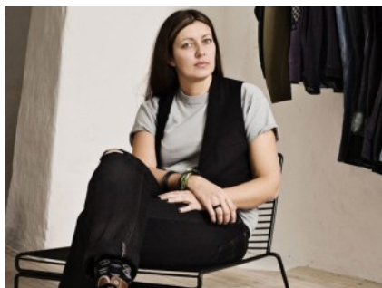
ラベルのデザイナー リッキー・コフ

デンマークで育った彼女はリーバイス・ストラウスでプレミアムラインのデザイン・ディレクターを務めた後、自身のデザインハウスを立ちあげる。