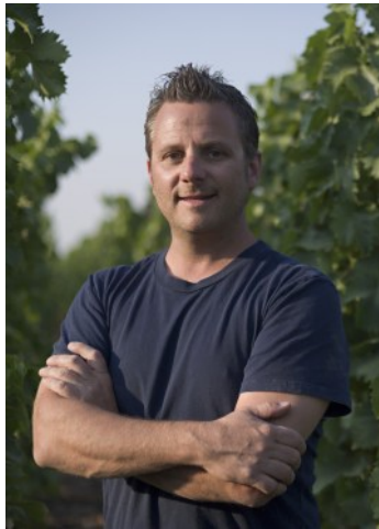
クリストフ・バロン