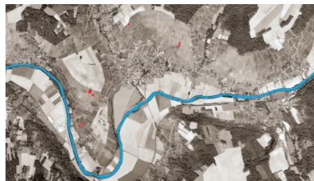
それぞれの自社畑の位置

産地・AOP：Champagne 品種：100% Pinot Meunier アルコール：12.5% 希望小売価格：¥50,000（税込¥55,000）