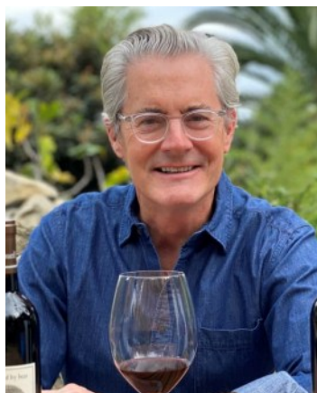
オーナー カイル・マクラクラン