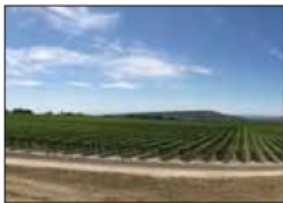
フィニー ヒル ヴィンヤード Phinney Hill Vineyard