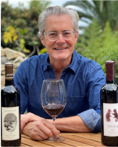
オーナー カイル・マクラクラン

オーナーであるカイル・マクラクランは、1990年に放送されたデヴィッド・リンチ原作のテレビ・シリーズ「ツイン・ピークス」のFBIの特別捜査官・デール・クーパーの役で幅広い人気を博したワシントン州出身の俳優です。ワインに強い関心を持っていたマクラクランは、2005年から俳優業と同じ様に自分の情熱を傾けられるもう一つの仕事としてワインづくりを始めました。ワシントン州のワイン生産の中心地、コロンビア・ヴァレーにあるヤキマ出身のマクラクランは、4種類のコロンビア・ヴァレー産ワインを造っており、いずれも高く評価されています。