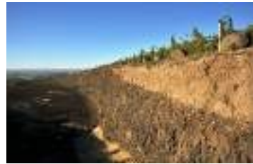
ファーガソン・ヴァインヤード

産地・AVA：Columbia Valley 品種：82% Semillon 18% Sauvignon Blanc アルコール：13.5% 希望小売価格：¥3,600（税込¥3,960）