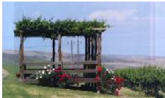
エステート・セブンヒルズ・ヴィンヤードのガジボ（見晴台）

レコール No 41はワラワラ・ヴァレーを米国の最もエキサイティングなブドウ栽培地域のひとつとして確立させる為に大いに尽力してきました。この地域の名声はワラワラ・ヴァレーのユニークな地質、気候とブドウ栽培が相俟って得ることができたのです。今日、レコール No 41はワラワラ・ヴァレー産ワインを最も多くつくっているワイナリーです。これらのワインはエステート・セブンヒルズ・ヴィンヤードとこの地域の卓越した畑