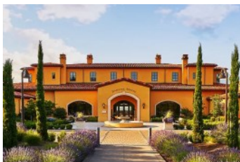
ザ・クラブハウス (ダンディ・ヒルズ)

産地・AVA : Dundee Hills 品種 : 46% Chardonnay 45% Pinot Noir 9% Brut Reserve アルコール : 12.5% 希望小売価格 : ¥20,000 (税込¥22,000)