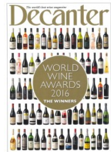
Decanter World Wine Awards 2016の最高メダルを獲得